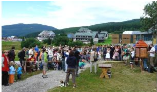
6. 9. 2008 byl na Malé Úpě slavnostně otevřen projekt